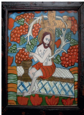
Icono de la viña, autor desconocido, proveniente de Transilvania.

Generalmente, los iconos que representan a Jesús - la viña están pintados sobre vidrio y se encuentran principalmente en la región de Transilvania. Son verdaderas obras de arte de nuestra iconografía popular. En uno de esos iconos, el Salvador está representado sentado sobre una mesita ante la cruz pintada en plata, las piernas y el torso desnudos, como en la escena de la crucifixión. Del lado izquierdo crece una viña con racimos de uva, que se enrolla en torno a la cruz describiendo un arco de círculo. El Salvador exprime los granos de uva en